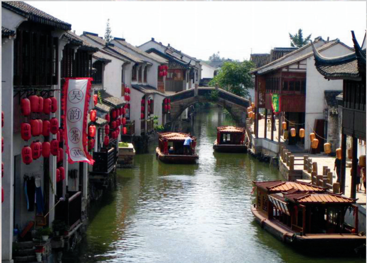
Pitorescul oraș Suzhou, în care s-a născut Su Tong

noastre, pentru că virtutea și răutatea omenirii sunt un subiect veșnic de discuții.”