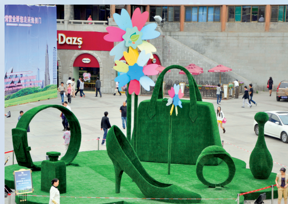
Obiecte realizate din plante în orașul Xi'an