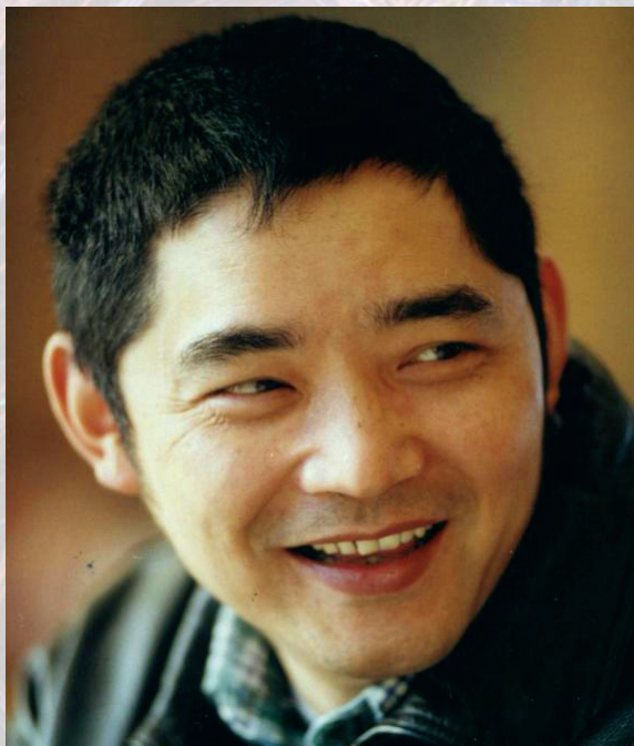
Scriitorul Su Tong

Su Tong se pricepe foarte bine cum să descrie figura feminină. După el, sexul feminin reflectă mai multe elemente care duc la crearea unui roman. Disperarea, indignarea și singurătatea femeilor de sub stiloul lui Su Tong au făcut ca cititorii să simtă profund starea de deprimare și sufocare. Încă din antichitatea chineză se spune că „Multe femei trăiesc într-o viață nefericită”. Acest lucru a fost dovedit cu minuțiozitate printr-un gust deosebit, în operele lui Su Tong. De mult timp, el este apreciat drept „scriitorul de sex masculin, care cunoaște cel mai bine femeile.” Despre acest elogiu, Su Tong spune: